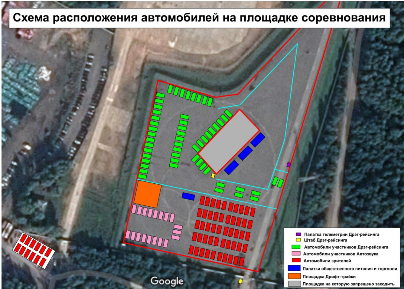
Схема расположения автомобилей на площадке соревнования